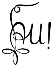
Zirkel der Unitas Franco-Alemannia

»Amicitia« (lat. Freundschaft) ist die Basis, auf die wir bauen. Denn nur aus der Gemeinschaft heraus entwickeln sich Virtus und Scientia. Diese Freundschaft, die auf Vertrauen beruht, möchten wir in einer modernen Form studentischer Traditionen fördern.