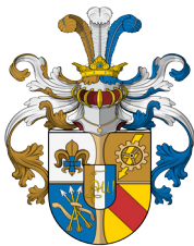
Wappen der Unitas Franco-Alemannia